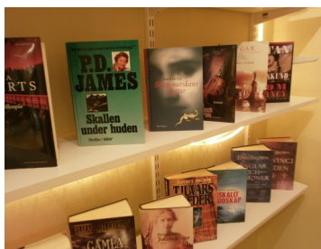
Böcker och filmer