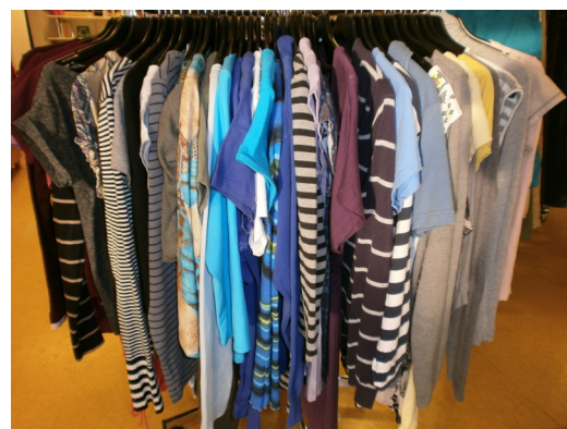
Vi har massor av fina second-handkläder