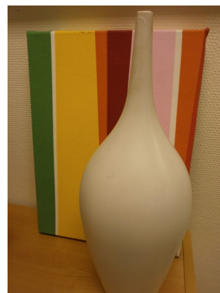
Saker/husgeråd och kuriosa